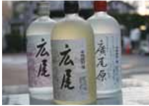
広尾ブランドの焼酎