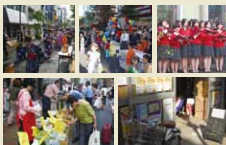
(左上) 打ち水 (中央上) 広尾フェア (右上) 聖歌隊キャロリング (左下) 朝市 (右下) ラジオクラブDJ