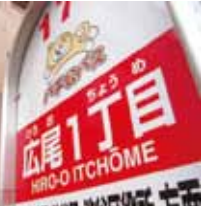
渋谷区コミュニティバス「ハチ公バス」バス停。かわいい車体も要チェックです。