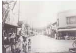
祥雲寺の前からの風景、広尾橋方面を望む 上：現在の様子 下：昭和29年頃の風景 (商店街の福引きの様子が伺える)