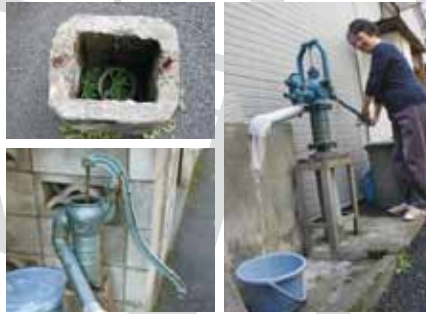
現在もいくつかの井戸が洗い物に打ち水にと大活躍。井戸の名残も見られる (左上)