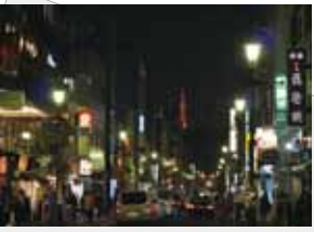
広尾散歩通りからは、東京タワーの夜景も楽しめる