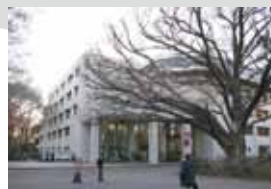
記念公園に併設されているのは5階建ての都立中央図書館。