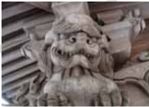
秋葉神社の彫り物