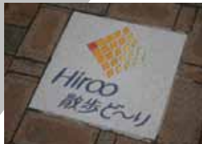
レンガ歩道のマーク