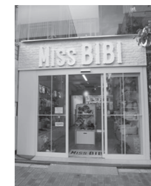
ペットサロン 株式会社 Miss BIBI 広尾5-2-25 本国ビル1F