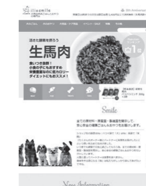
犬用自然派おやつ専門店 株式会社イリオスマイル 広尾5-3-6 T-HOUSE広尾