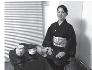
茶道教室 Tea Ceremony Salon produced by Mikiko Kono 広尾5-18-10 広尾ピア柴田501