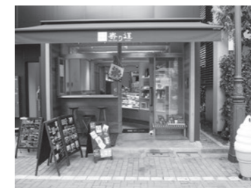
和カフェ 賛否両論 寄り道 広尾5-17-4