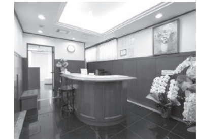
婦人科・産科・乳腺外科・肛門科 広尾 まぎレディスクリニック 広尾5-19-7 協和ビル3F