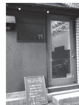
肉々春巻・家庭料理 キッチン屯(たむろ) 広尾5-19-3