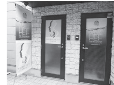
水素サロン 水素・酸素美容研究所 広尾5-3-4 広尾ハウス53