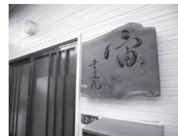
書デザイン・書道教室 宙(そら)書道院 広尾5-2-18