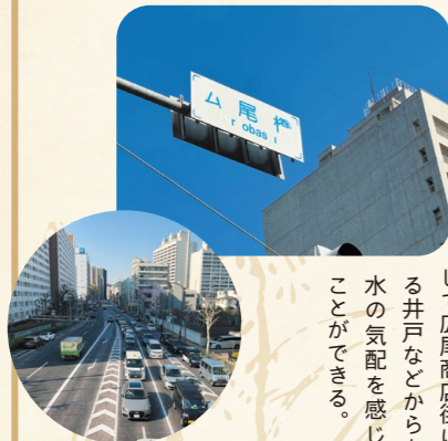
▲広尾駅あたりから外苑西通りは暗渠となっている