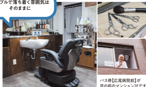
バス停【広尾病院前】が目の前のマンション2Fです