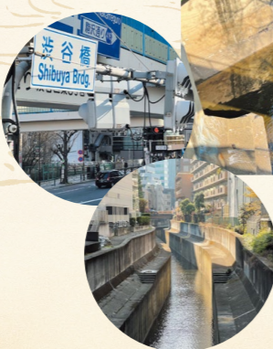
▶筈川(左)と渋谷川(右)の合流地点

つまり広尾周辺は、もともと複数の川が重なる「水」の地形の上に築かれてきた街だったのである。そのため人々は行き来のために多くの橋を架け、その一つひとつに名前を与えてきた。