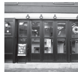
ドイツ菓子・カフェ シュロス・ベッカライ 広尾5-19-2 PIPE 1F