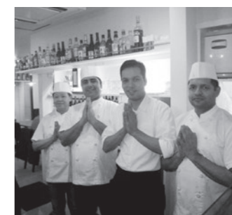
タイ・インド料理 マサラキッチン 広尾5-5-1 広尾いがらしビルB1