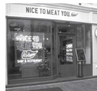
肉料理 NICE TO MEAT YOU 広尾5-3-15