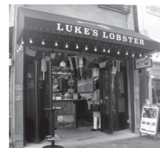
ロブスターロール LUKE'S LOBSTER 広尾5-3-16 奥本いろは堂ビル1F