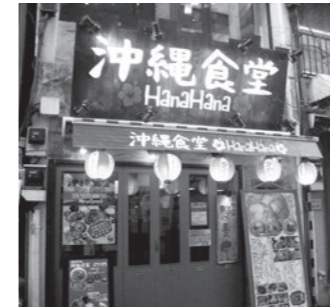
沖縄食堂 Hana Hana 広尾 広尾5-3-12