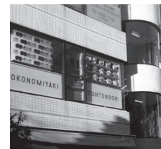
お好み焼 道とん堀 広尾5-1-20 七星舎ビル2F