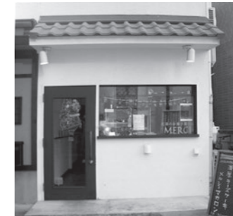
広尾のお菓子屋さん Merci(メルシー) 広尾5-8-1