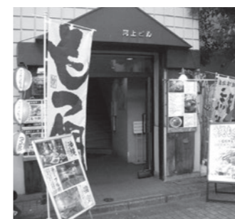
沖縄料理 花唄 広尾店 広尾5-17-6 河上ビルB1