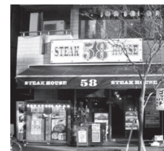
ステーキハウス58 広尾5-16-2 T&Kビル1・2F